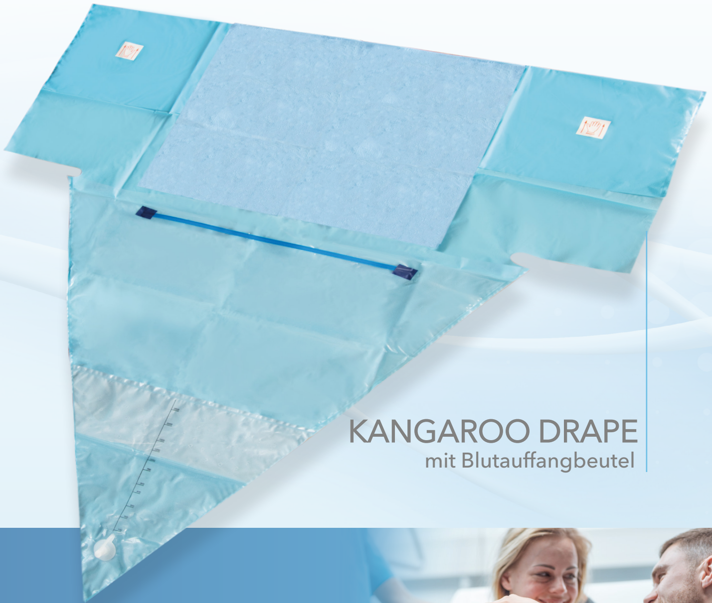
KANGAROO DRAPE mit Blutauffangbeutel

Die zeitgemäße Lösung für eine sichere Kontrolle des Blutverlustes während der Geburt